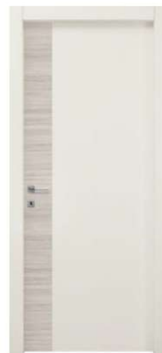
MOD. NC05 ROVERE CENERE + RAL 9002 / OAK ASH + RAL 9002