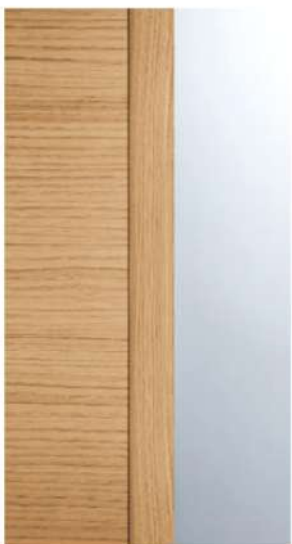
DETTAGLIO / DETAIL