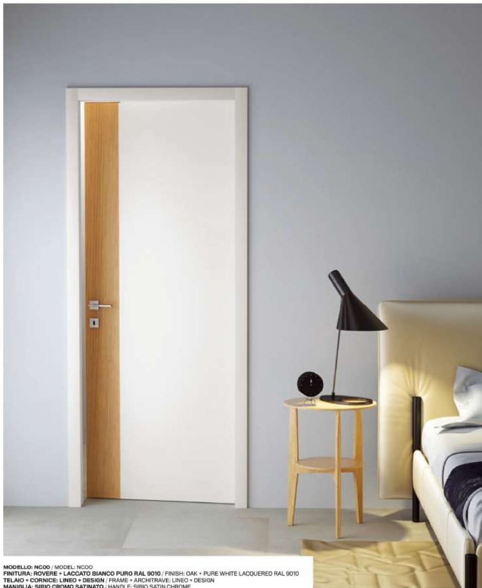
MODELLO: NCOO / MODEL: NCOO FINITURA: ROVERE + LACCATO BIANCO PURO RAL 9010 / FINISH: OAK + PURE WHITE LACQUERED RAL 9010 TELAIO + CORNICE: LINEO + DESIGN / FRAME + ARCHITRAVE: LINEO + DESIGN MANIGLIA: SIRIO CROMO SATINATO / HANDLE: SIRIO SATIN CHROME