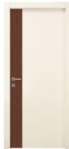
MOD. NC00 PINO GRAFFIATO ANTICO + RAL 9001 / ANTIQUE SCRATCHED PINE + RAL 9001