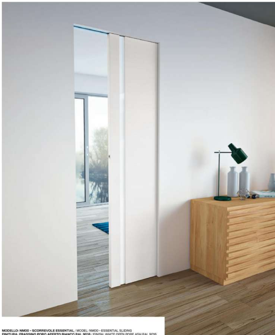
MODELLO: NM00 - SCORREVOLE ESSENTIAL / MODEL: NM00 - ESSENTIAL SLIDING FINITURA: FRASSINO PORO APERTO BIANCO RAL 9016 / FINISH: WHITE OPEN PORE ASH RAL 9016