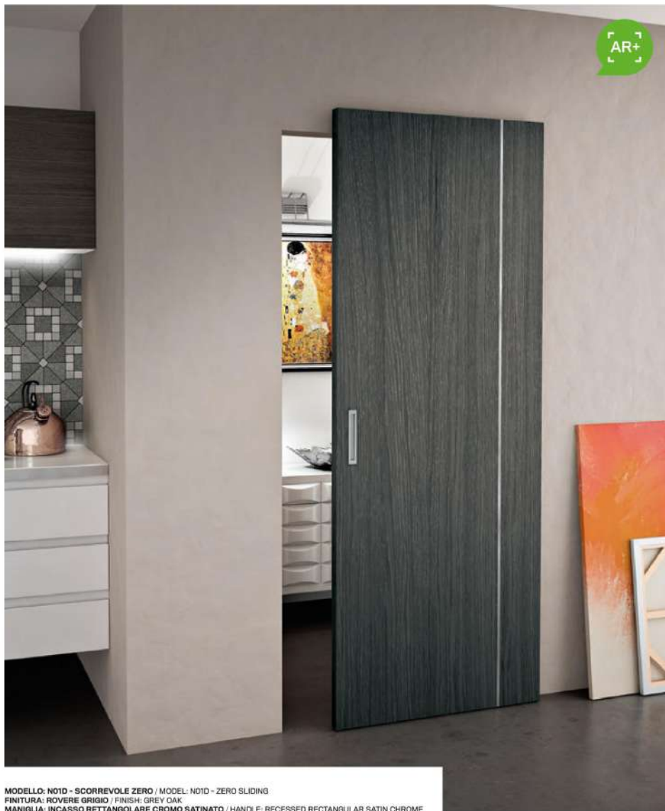
MODELLO: N01D - SCORREVOLE ZERO / MODEL: N01D - ZERO SLIDING FINITURA: ROVERE GRIGIO / FINISH: GREY OAK MANIGLIA: INCASSO RETTANGOLARE CROMO SATINATO / HANDLE: RECESSED RECTANGULAR SATIN CHROME