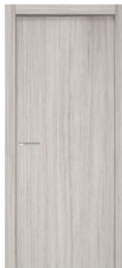
MOD. N00 ROVERE CENERE / OAK ASH