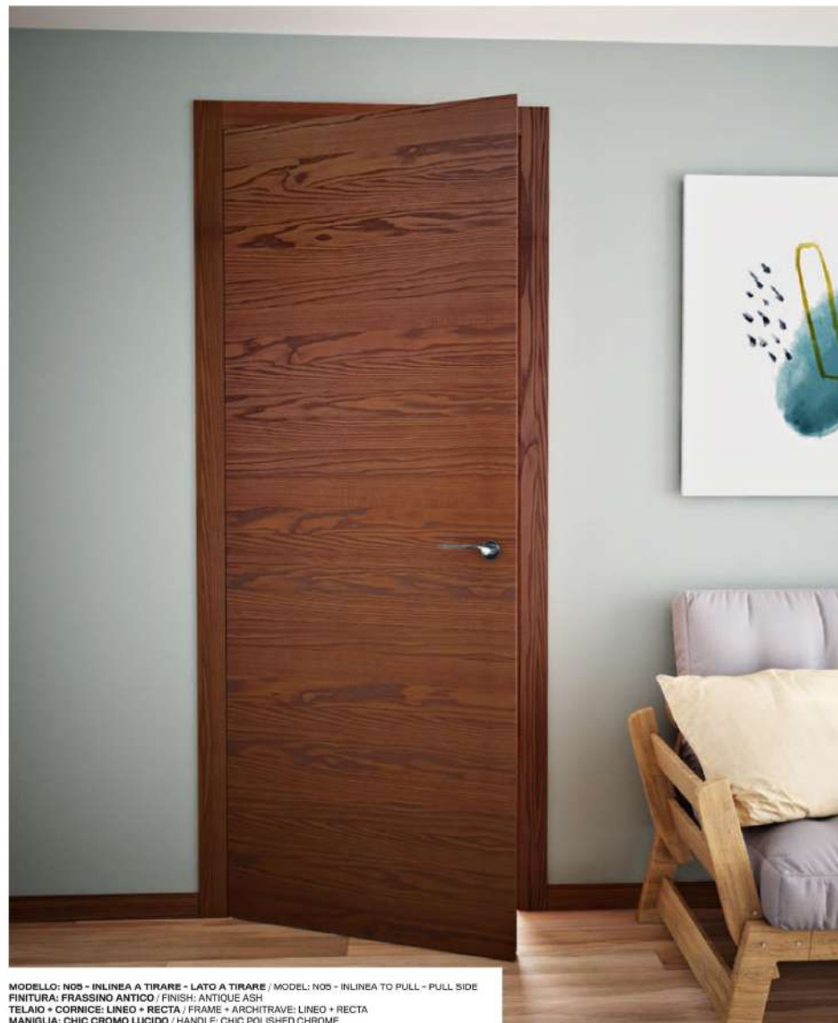
MODELLO: N09 - INLINEA A TIRARE - LATO A TIRARE / MODEL: N09 - INLINEA TO PULL - PULL SIDE FINITURA: FRASSINO ANTICO / FINISH: ANTIQUE ASH TELAIO + CORNICE: LINEO + RECTA / FRAME + ARCHITRAVE: LINEO + RECTA MANIGLIA: CHIC CROMO LUCIDO / HANDLE: CHIC POLISHED CHROME