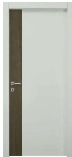
MOD. NC00 ROVERE GRIGIO + RAL 7035 / GREY OAK + RAL 7035