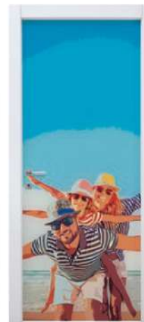
MOD. STILE 3