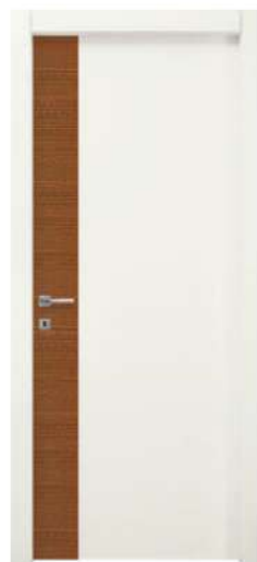
MOD. NC05 PINO GRAFFIATO RAME + RAL 9016 / COPPER SCRATCHED PINE + RAL 9016