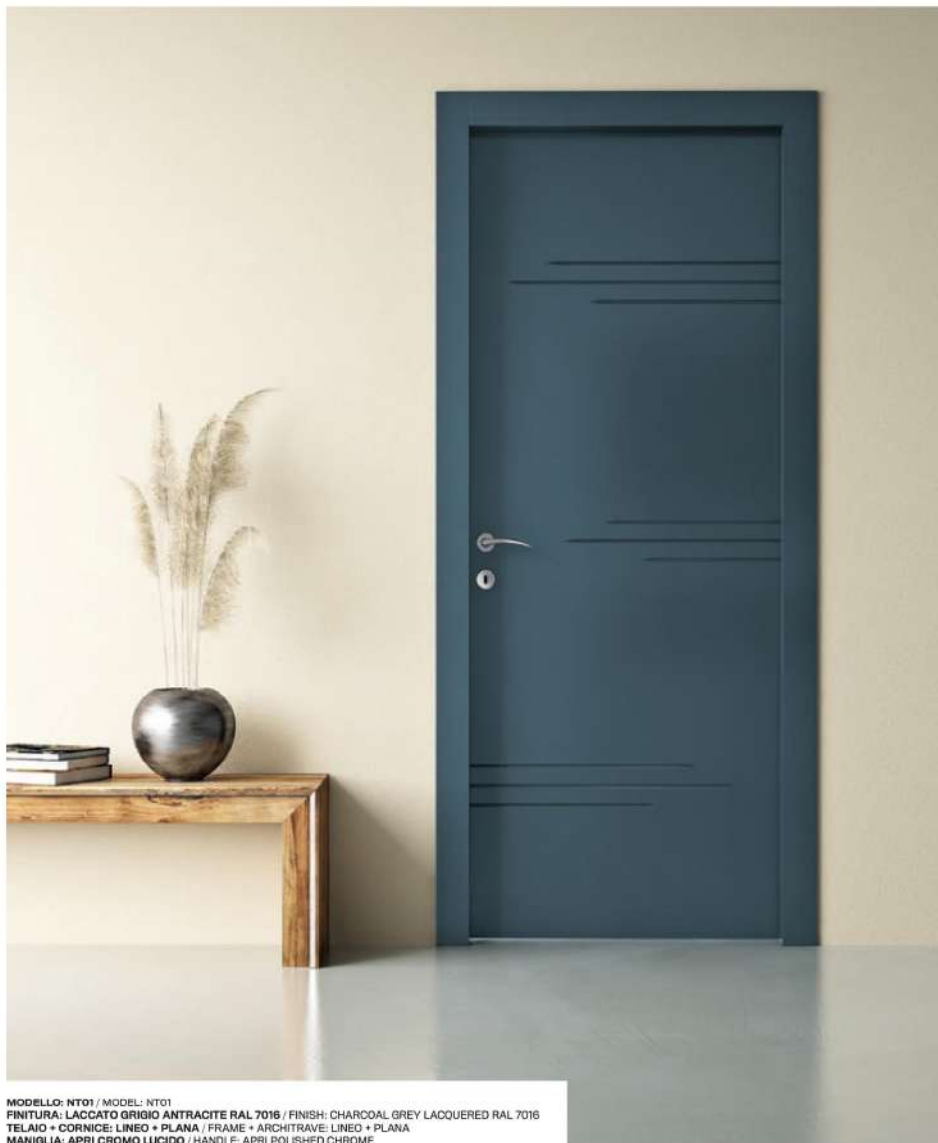
MODELLO: NT01 / MODEL: NT01 FINITURA: LACCATO GRIGIO ANTRACITE RAL 7016 / FINISH: CHARCOAL GREY LACQUERED RAL 7016 TELAIO + CORNICE: LINEO + PLANA / FRAME + ARCHITRAVE: LINEO + PLANA MANIGLIA: APRI CROMO LUCIDO / HANDLE: APRI POLISHED CHROME