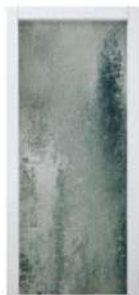
MOD. MODERNO 1