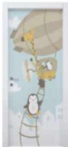
MOD. BIMBI 2