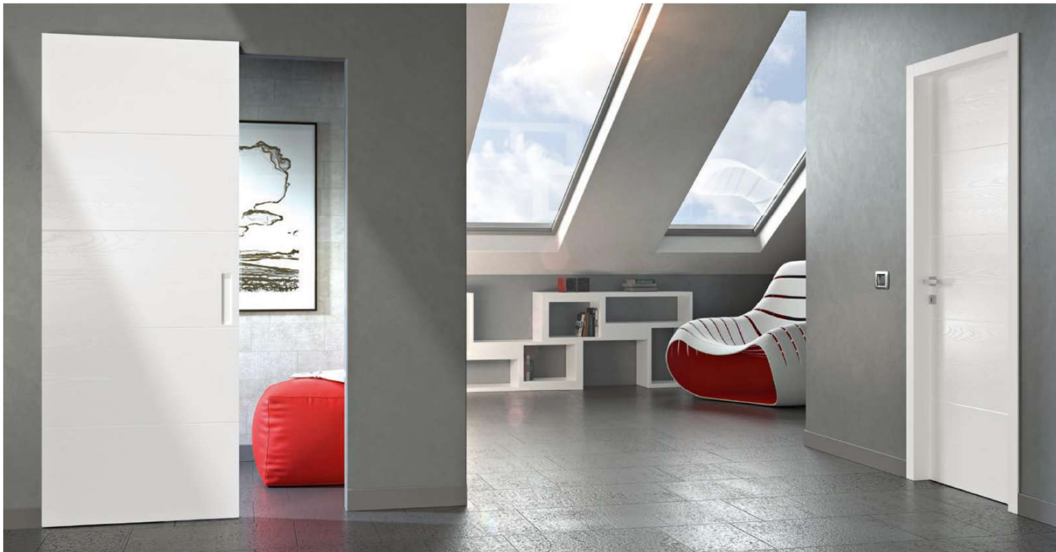
MODELLO: N15 - SCORREVOLE ZERO / MODEL: N15 - ZERO SLIDING FINITURA: FRASSINO PORO APERTO BIANCO RAL 9016 / FINISH: OPEN PORE WHITE ASH RAL 9016 MANIGLIA: INCASSO RICAVATA / HANDLE: RECESSED BUILT-IN