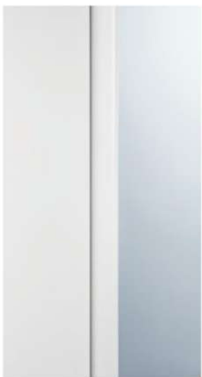
DETTAGLIO FERMAVETRO / GLAZING BEAD DETAIL