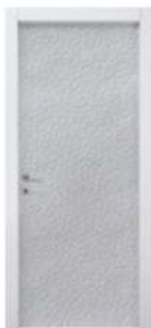
MOD. PELLE 1