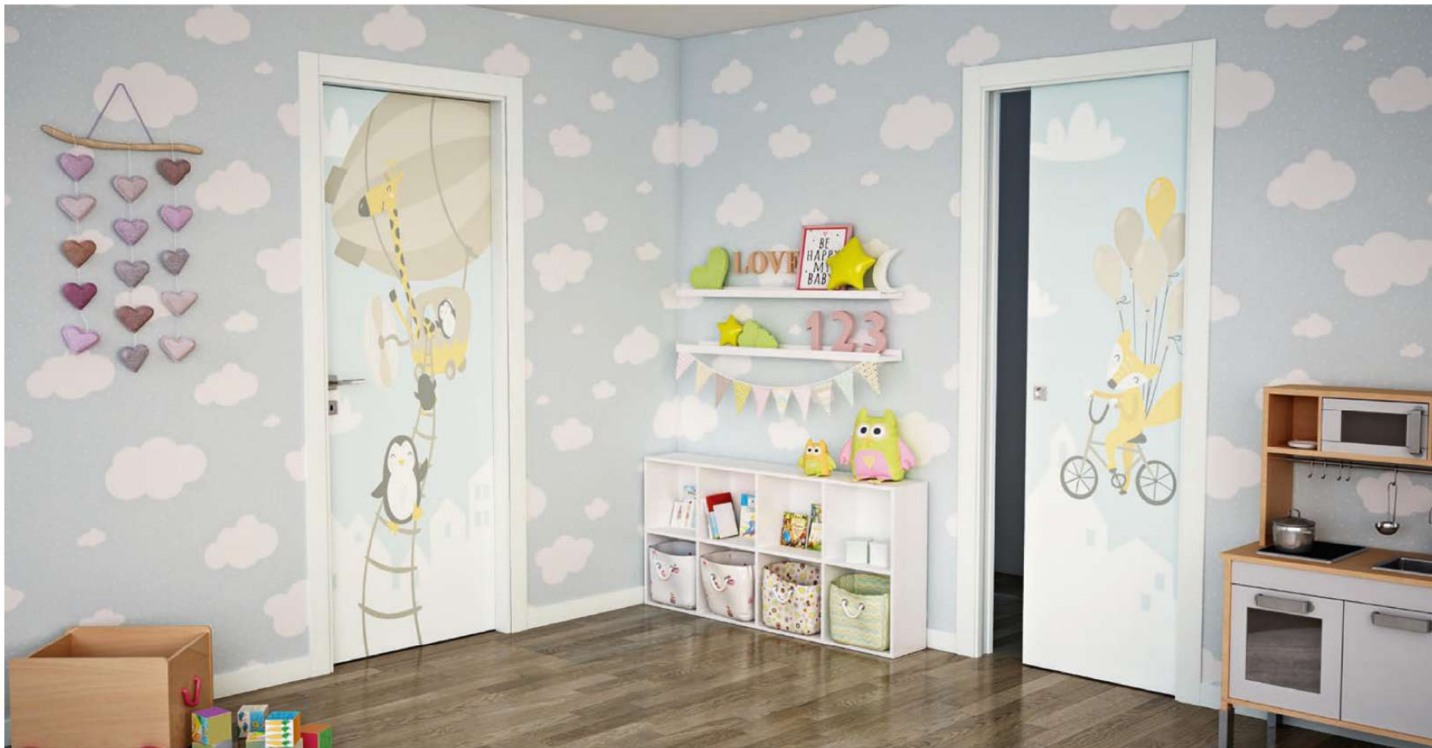
MODELLO: N00 - STAMPA DIGITALE / MODEL: N00 - DIGITAL PRINTING FINITURA: LACCATO BIANCO RAL 9016 / FINISH: WHITE LACQUERED RAL 9016 TELAIO + CORNICE: LINEO + RECTA / FRAME + ARCHITRAVE: LINEO + RECTA MANIGLIA: EQUINOX CROMO SATINATO / HANDLE: EQUINOX SATIN CHROME