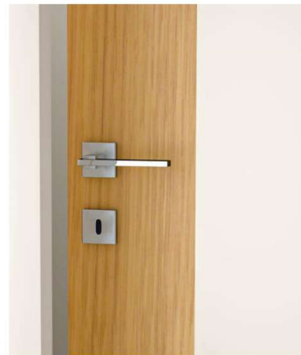
Combina unisce, in una sola anta, legno e laccato. Una doppia finitura dallo stile deciso, che esalta l'importanza della porta tra gli elementi dell'arredo. Il tranciato dell'antina piccola può essere orientato in verticale o in orizzontale, a seconda delle preferenze. Combina combines wood and lacquer in a single leaf. A double finish with a decisive style, which enhances the importance of the door among the furnishing elements. The veneer of the cabinet door can run vertically or horizontally, depending on your preferences.