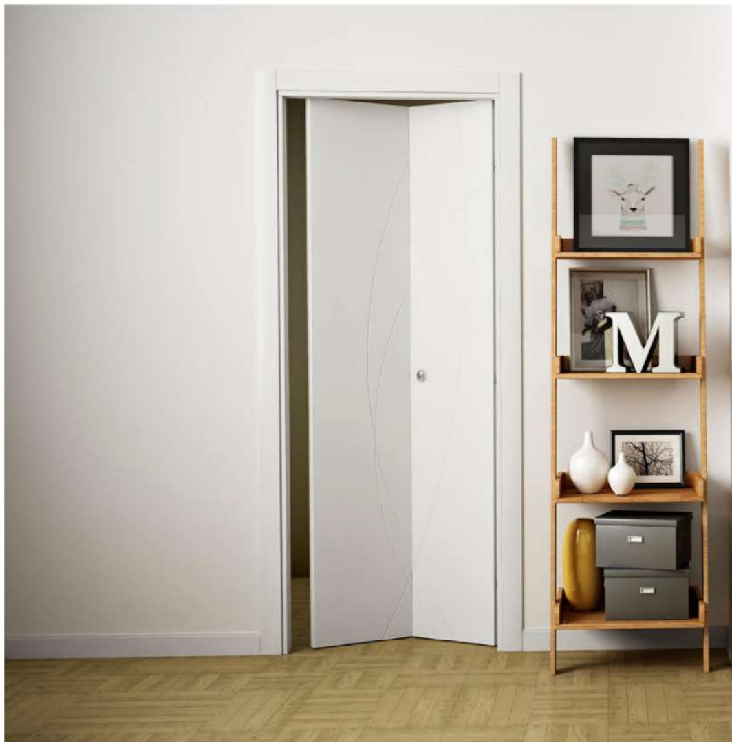
MODELLO: N21A - LIBRO 1/2-1/2 / MODEL: N21A - 1/2-1/2 FOLDING FINITURA: LACCATO GRIGIO ICA 0238 / FINISH: GREY LACQUERED ICA 0238 TELAIO + CORNICE: LINEO + RECTA / FRAME + ARCHITRAVE: LINEO + RECTA MANIGLIA: KIT DI CHIUSURA TONDO CROMO SATINATO / HANDLE: ROUND SATIN CHROME CLOSING KIT