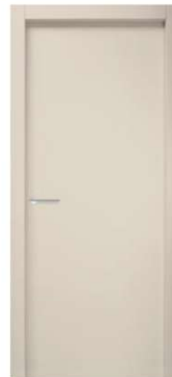
MOD. N00 BECKER 4575