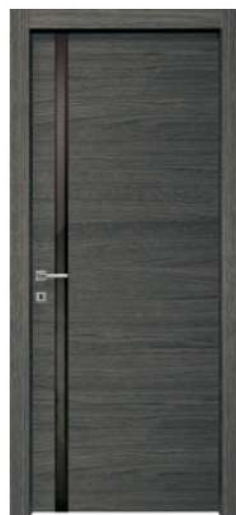
MOD. NM00 ROVERE GRIGIO / GREY OAK