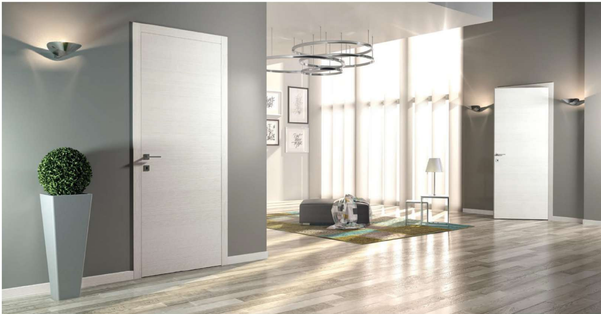
MODELLO: NO5 - INLINEA / MODEL: NO5 - INLINEA FINITURA: PINO GRAFFIATO LACCATO BIANCO RAL 9016 / FINISH: SCRATCHED PINE WHITE LACQUERED RAL 9016 TELAIO + CORNICE: LINEO + PLANA / FRAME + ARCHITRAVE: LINEO + PLANA MANIGLIA: PEGASO CROMO SATINATO / HANDLE: PEGASO SATIN CHROME