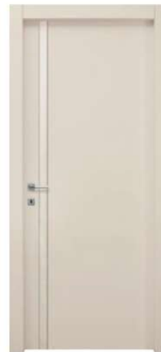
MOD. NM00 BECKER 4575