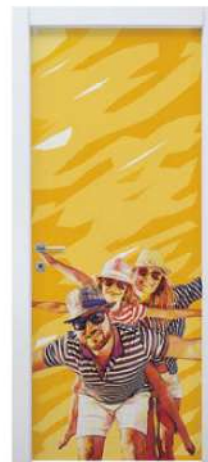
MOD. STILE 2