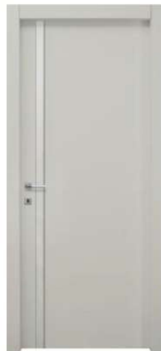
MOD. NM00 RAL 7044