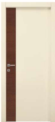
MOD. NC05 FRASSINO ANTICO + RAL 1013 / ANTIQUE ASH + RAL 1013