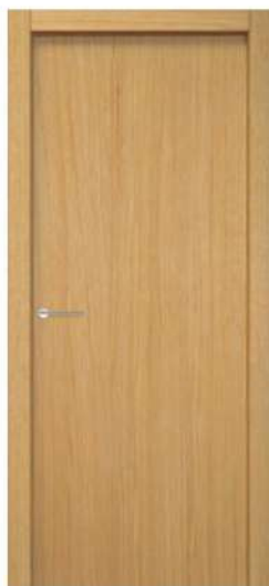
MOD. N00 ROVERE / OAK