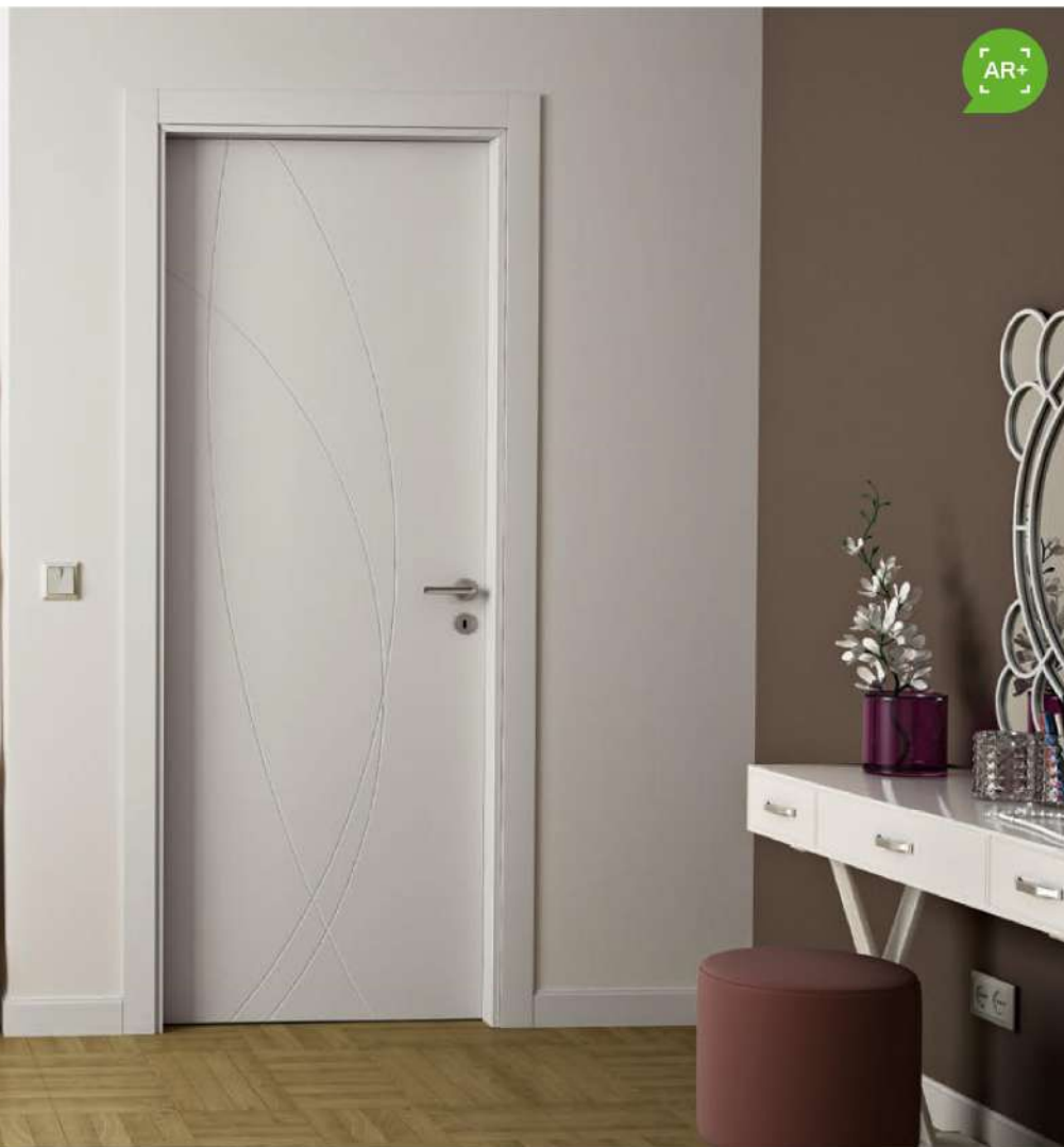
MODELLO: N21A / MODEL: N21A FINITURA: LACCATO GRIGIO ICA 0238 / FINISH: GREY LACQUERED ICA 0238 TELAIO + CORNICE: LINEO + RECTA / FRAME + ARCHITRAVE: LINEO + RECTA MANIGLIA: LUCY CROMO SATINATO / HANDLE: LUCY SATIN CHROME