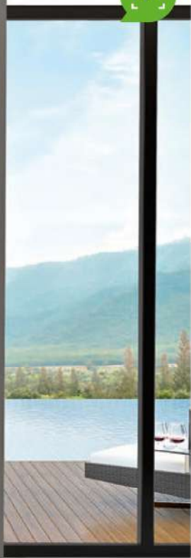
MODELLO: NOBH / MODEL: NOBH FINITURA: ROVERE CENERE / FINISH: OAK ASH TELAIO + CORNICE: LINEO + RECTA / FRAME + ARCHITRAVE: LINEO + RECTA MANIGLIA: PEGASO CROMO SATINATO / HANDLE: PEGASO SATIN CHROME