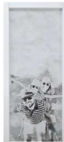
MOD. STILE 1