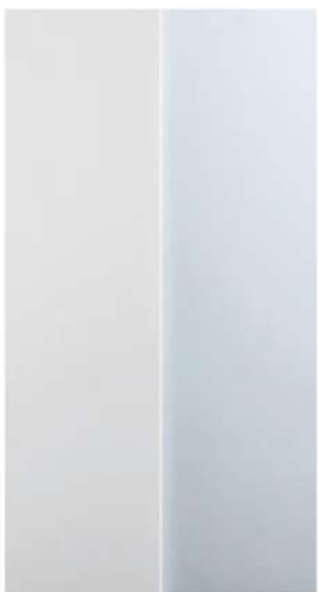
DETTAGLIO / DETAIL