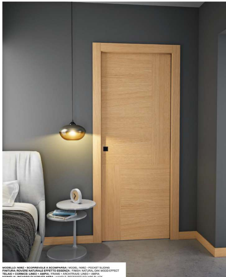
MODELLO: N06Z - SCOPPIREVOLTE A SCOMPARSITA / MODEL: N06Z - POCKET SLIDING FINITURA: ROVERE NATURALE EFFETTO ESSENZA / FINISH: NATURAL OAK WOOD EFFECT TELAIO + CORNICE: LINEO + AMPIA / FRAME + ARCHITRAVE: LINEO + AMPIA MANIGLIA: INCASSO QUADRATA NERA / HANDLE: RECESSED SQUARE BLACK

La lavorazione a intarsio è quella preferita da chi ama le venature naturali del legno, perché le valorizza, rispettandone l'aspetto originale. Un decoro dalla tradizione antica, che rende la porta un grande oggetto di design. The inlay work is the one preferred by those who love natural wood grain because it enhances it, respecting their original appearance. A decoration with an ancient tradition, which makes the door a great design object.