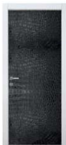
MOD. PELLE 2