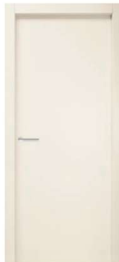
MOD. N00 RAL 9001