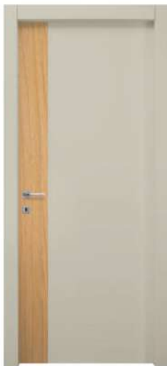
MOD. NC00 ROVERE + RAL 7044 / OAK + RAL 7044

Disponibili anche tutte le altre finiture, laccate e in tranciato. Other types finishes, lacquered and veneer, are also available.