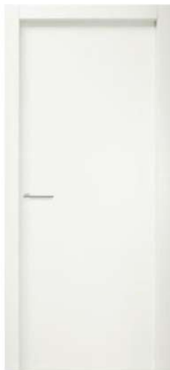
MOD. N00 RAL 9016

Disponibili anche tutte le altre finiture, laccate e in tranciato. Other types finishes, lacquered and veneer, are also available.