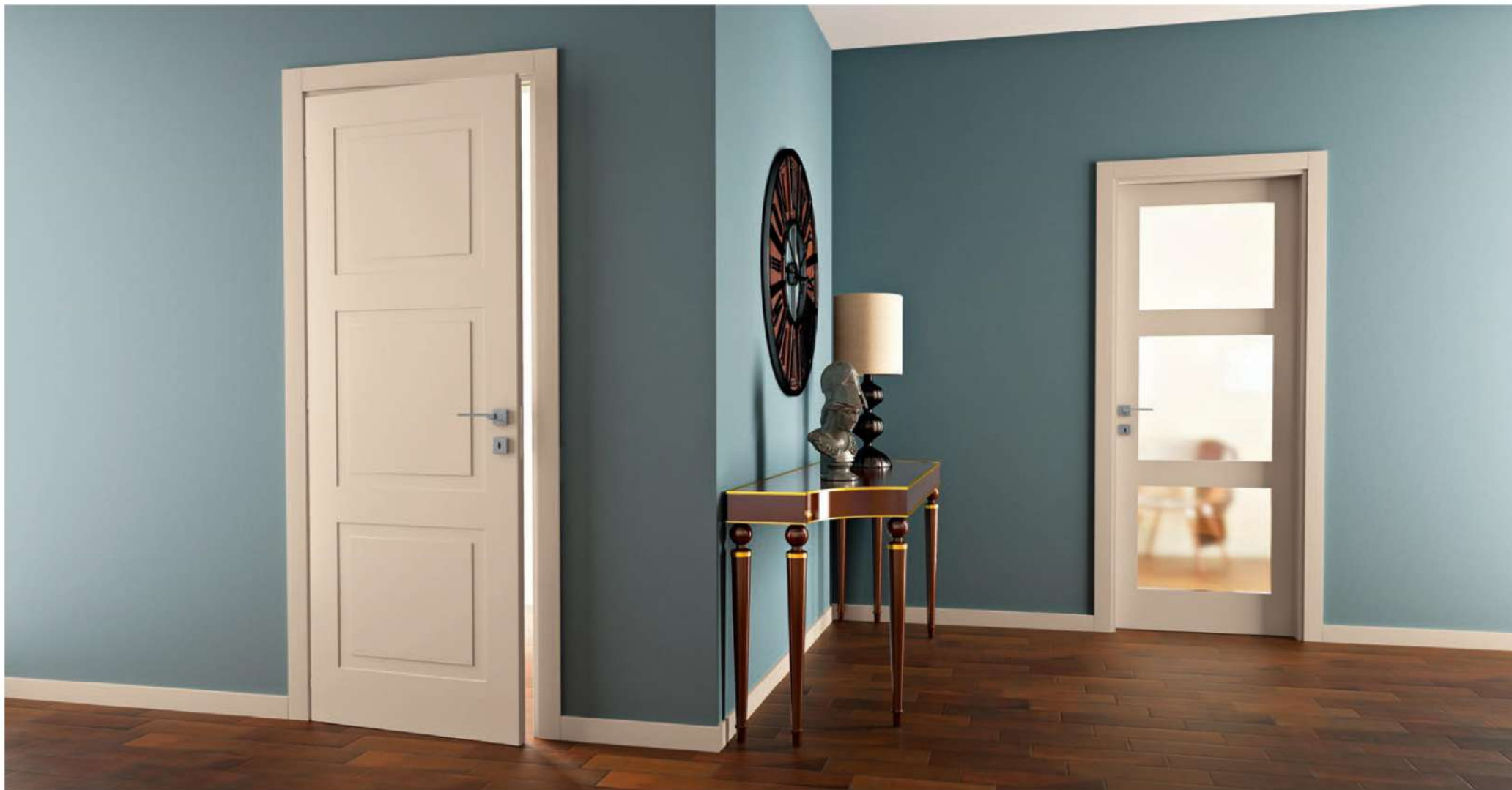
MODELLO: NR30 / MODEL: NR30 FINITURA: LACCATO NOCCIOLA BECKER 4575 / FINISH: HAZELNUT LACQUERED BECKER 4575 TELAIO + CORNICE: LINEO + AMPIA / FRAME + ARCHITRAVE: LINEO + AMPIA MANIGLIA: BELLA CROMO SATINATO / HANDLE: BELLA SATIN CHROME