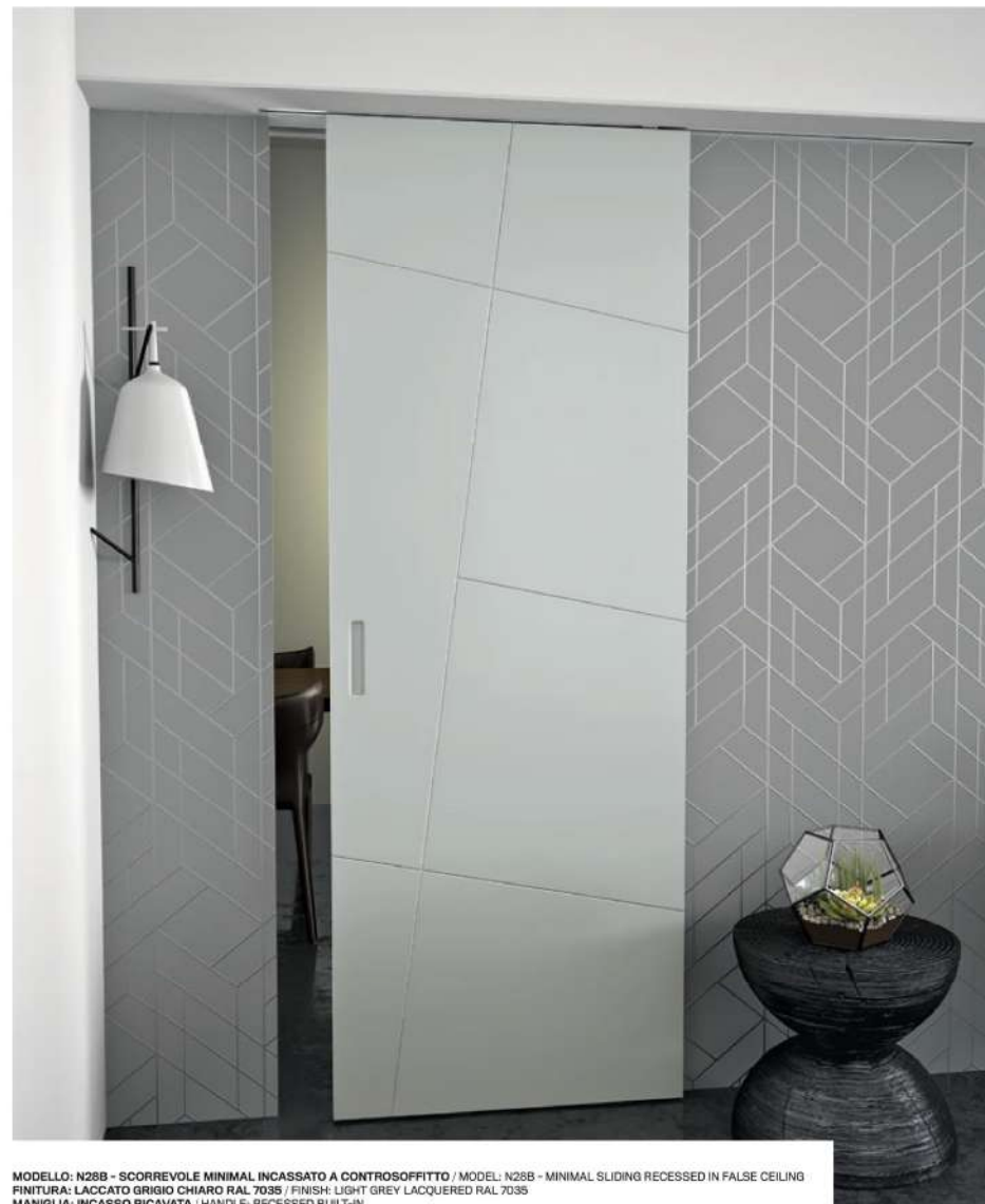
MODELLO: N28B - SCORREVOLE MINIMAL INCASSATO A CONTROSOFFITTO / MODEL: N28B - MINIMAL SLIDING RECESSED IN FALSE CEILING FINITURA: LACCATO GRIGIO CHIARO RAL 7035 / FINISH: LIGHT GREY LACQUERED RAL 7035 MANIGLIA: INCASSO RICAVATA / HANDLE: RECESSED BUILT-IN

La classica incisione a "V" dallo stile minimale, perfetta per chi vuole una porta lavorata senza rinunciare alla semplicità. Oltre ai modelli di listino, è possibile realizzare disegni su richiesta. Classical minimalist style "V" engraving, perfect for those who want a stylish door without sacrificing simplicity. Custom designs are available in addition to the models in the catalogue.