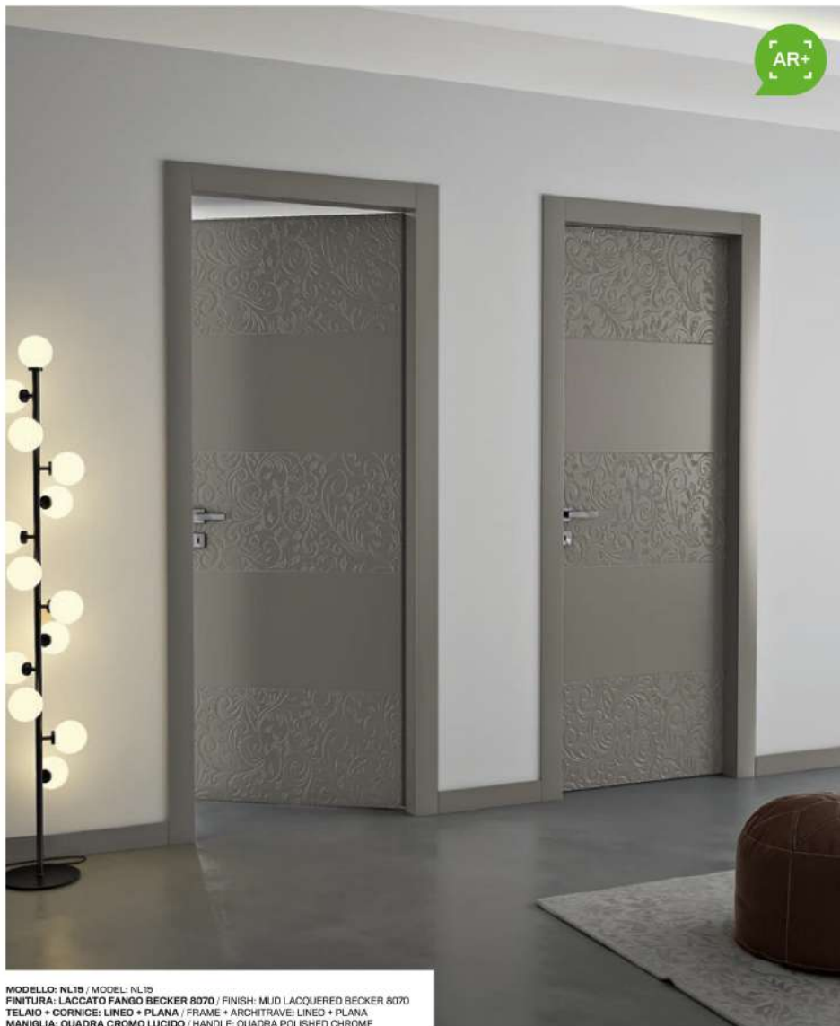
MODELLO: NL19 / MODEL: NL19 FINITURA: LACCATO FANGO BECKER 8070 / FINISH: MUD LACQUERED BECKER 8070 TELAIO + CORNICE: LINEO + PLANA / FRAME + ARCHITRAVE: LINEO + PLANA MANIGLIA: QUADRA CROMO LUCIDO / HANDLE: QUADRA POLISHED CHROME