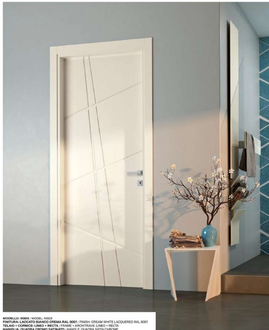
MODELLO: NG03 / MODEL: NG03 FINITURA: LACCATO BIANCO CREMA RAL 9001 / FINISH: CREAM WHITE LACQUERED RAL 9001 TELAIO + CORNICE: LINEO + RECTA / FRAME + ARCHITRAVE: LINEO + RECTA MANIGLIA: QUADRA CROMO SATINATO / HANDLE: QUADRA SATIN CHROME

È un'evoluzione della porta incisa, in cui vengono utilizzate due diverse punte per creare geometrie accattivanti e moderne. Oltre ai modelli di listino, è possibile realizzare disegni su richiesta. This is the evolution of the engraved door, where two different bits are used to create eye-catching and modern geometries. Custom designs are available in addition to the models in the catalogue.