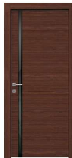
MOD. NM00 PINO GRAFFIATO ANTICO / ANTIQUE SCRATCHED PINE