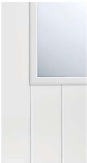
DETTAGLIO / DETAIL