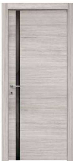
MOD. NM00 ROVERE CENERE / OAK ASH