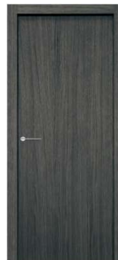
MOD. N00 ROVERE GRIGIO / GREY OAK