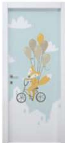
MOD. BIMBI 3