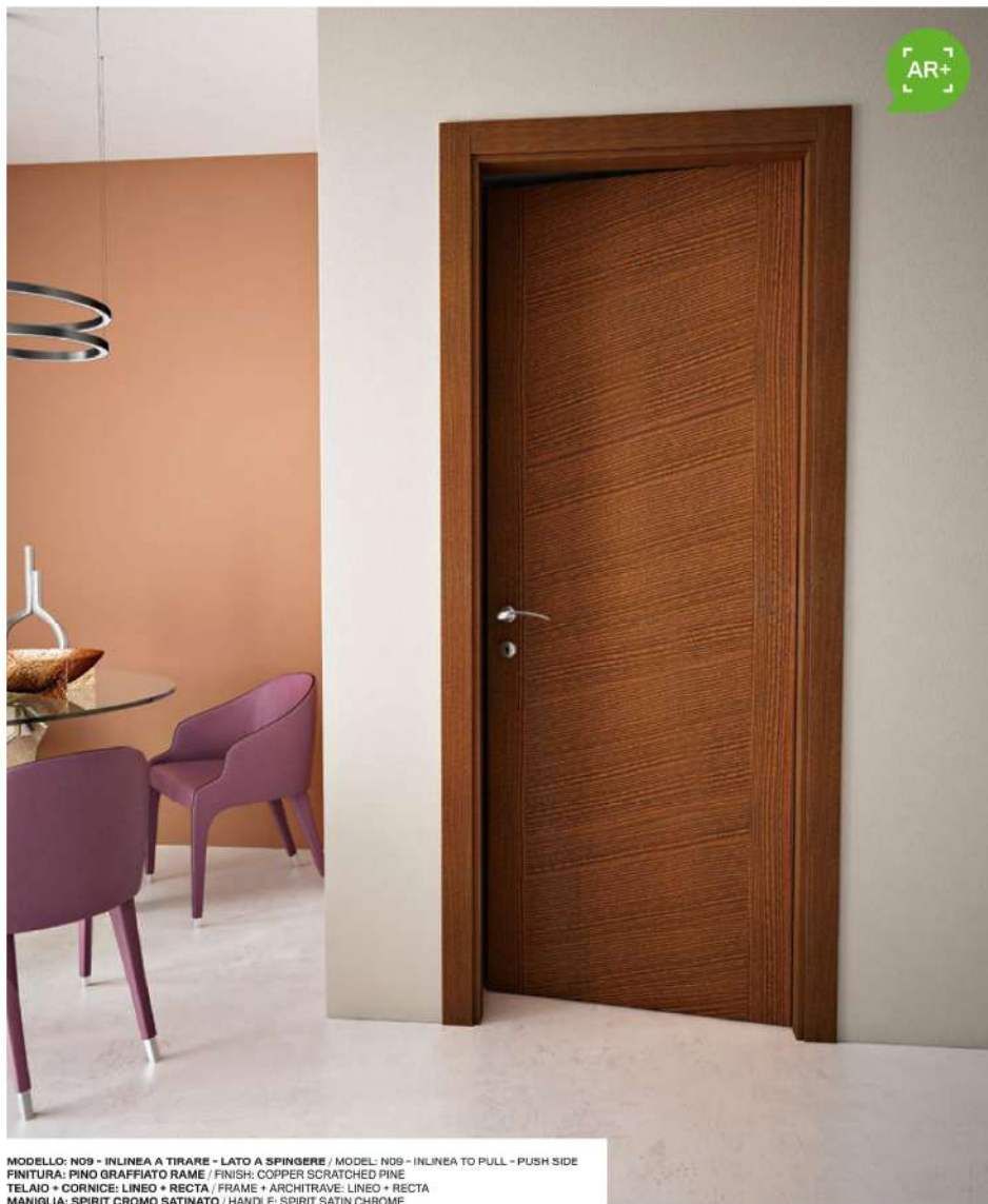
MODELLO: N09 - INLINEA A TIRARE - LATO A SPINGERE / MODEL: N09 - INLINEA TO PULL - PUSH SIDE FINITURA: PINO GRAFFIATO RAME / FINISH: COPPER SCRATCHED PINE TELAIO + CORNICE: LINEO + RECTA / FRAME + ARCHITRAVE: LINEO + RECTA MANIGLIA: SPIRIT CROMO SATINATO / HANDLE: SPIRIT SATIN CHROME