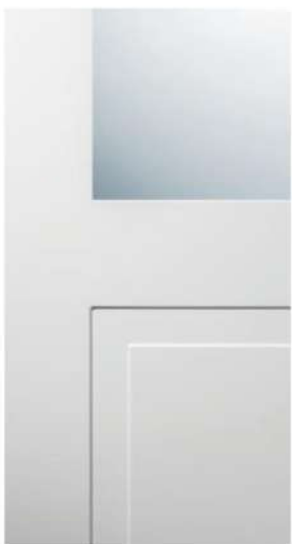
DETTAGLIO / DETAIL