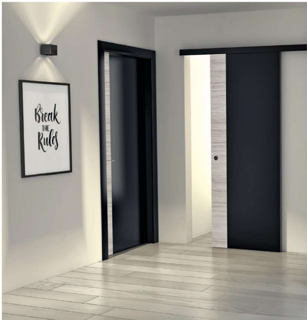
MODELLO: NC05 - SCORREVOLE ESTERNO MINIMAL / MODEL: NC05 - MINIMAL EXTERNAL SLIDING FINITURA: ROVERE CENERE + LACCATO NERO RAL 9005 / FINISH: OAK ASH + BLACK LACQUERED RAL 9005 TELAIO + CORNICE: LINEO + AMPIA / FRAME + ARCHITRAVE: LINEO + AMPIA MANIGLIA: TONDA NERA / HANDLE: ROUND BLACK