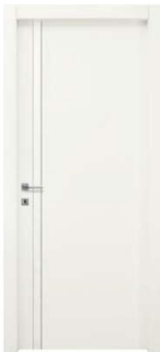
MOD. NM00 RAL 9016

Disponibili anche tutte le altre finiture, laccate e in tranciato. Other types finishes, lacquered and veneer, are also available.