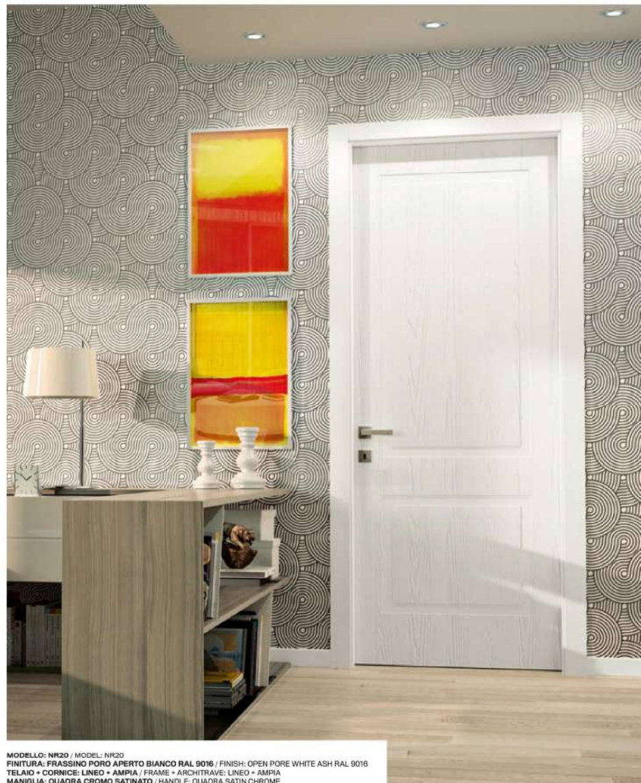
MODELLO: NR20 / MODEL: NR20 FINITURA: FRASSINO PORO APERTO BIANCO RAL 9016 / FINISH: OPEN PORE WHITE ASH RAL 9016 TELAIO + CORNICE: LINEO + AMPIA / FRAME + ARCHITRAVE: LINEO + AMPIA MANIGLIA: QUADRA CROMO SATINATO / HANDLE: QUADRA SATIN CHROME

Un'incisione squadrata, di elegante linearità, intrigante alternativa alla classica pantografatura. Se applicata su un'anta a poro aperto, l'effetto è di una doppia finitura: legno liscio all'interno, venature in rilievo all'esterno. È possibile realizzare disegni su richiesta. Squared engraving, with elegant linearity, an intriguing alternative to the classic pantograph. If applied on an open pore door, the effect is a double finish: smooth wood inside, raised veins on the outside. It is possible to create designs upon request.