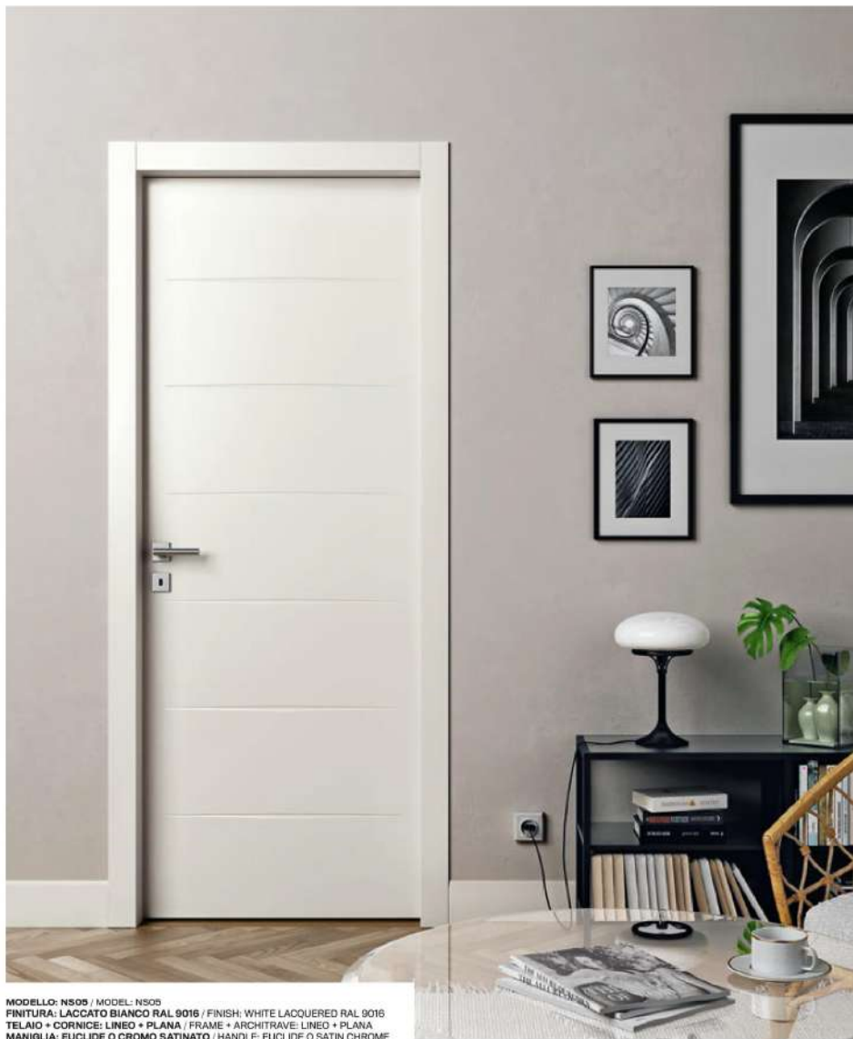
MODELLO: NS05 / MODEL: NS05 FINITURA: LACCATO BIANCO RAL 9016 / FINISH: WHITE LACQUERED RAL 9016 TELAIO • CORNICE: LINEO • PLANA / FRAME • ARCHITRAVE: LINEO • PLANA MANIGLIA: EUCLIDE Q CROMO SATINATO / HANDLE: EUCLIDE Q SATIN CHROME