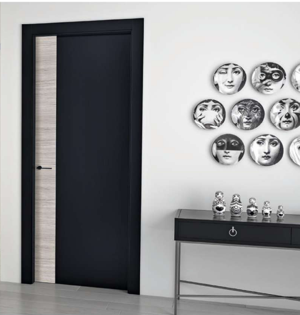
MODELLO: NC09 / MODEL: NC09 FINITURA: ROVERE CENERE + LACCATO NERO RAL 9005 / FINISH: OAK ASH + BLACK LACQUERED RAL 9005 TELAIO + CORNICE: LINEO + AMPIA / FRAME + ARCHITRAVE: LINEO + AMPIA MANIGLIA: NUDA MOD. ATLANTA NERA / HANDLE: NUDA MOD. ATLANTA BLACK