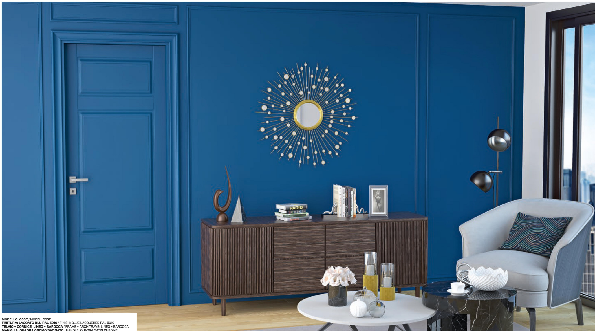
MODELLO: C35F / MODEL: C35F FINITURA: LACCATO BLU RAL 5010 / FINISH: BLUE LACQUERED RAL 5010 TELAIO + CORNICE: LINEO + BAROCCA / FRAME + ARCHITRAVE: LINEO + BAROCCA MANIGLIA: QUADRA CROMO SATINATO / HANDLE: QUADRA SATIN CHROME