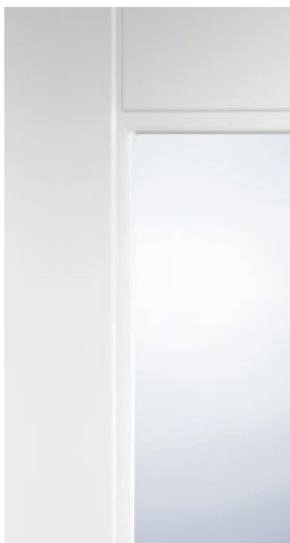
DETTAGLIO / DETAIL