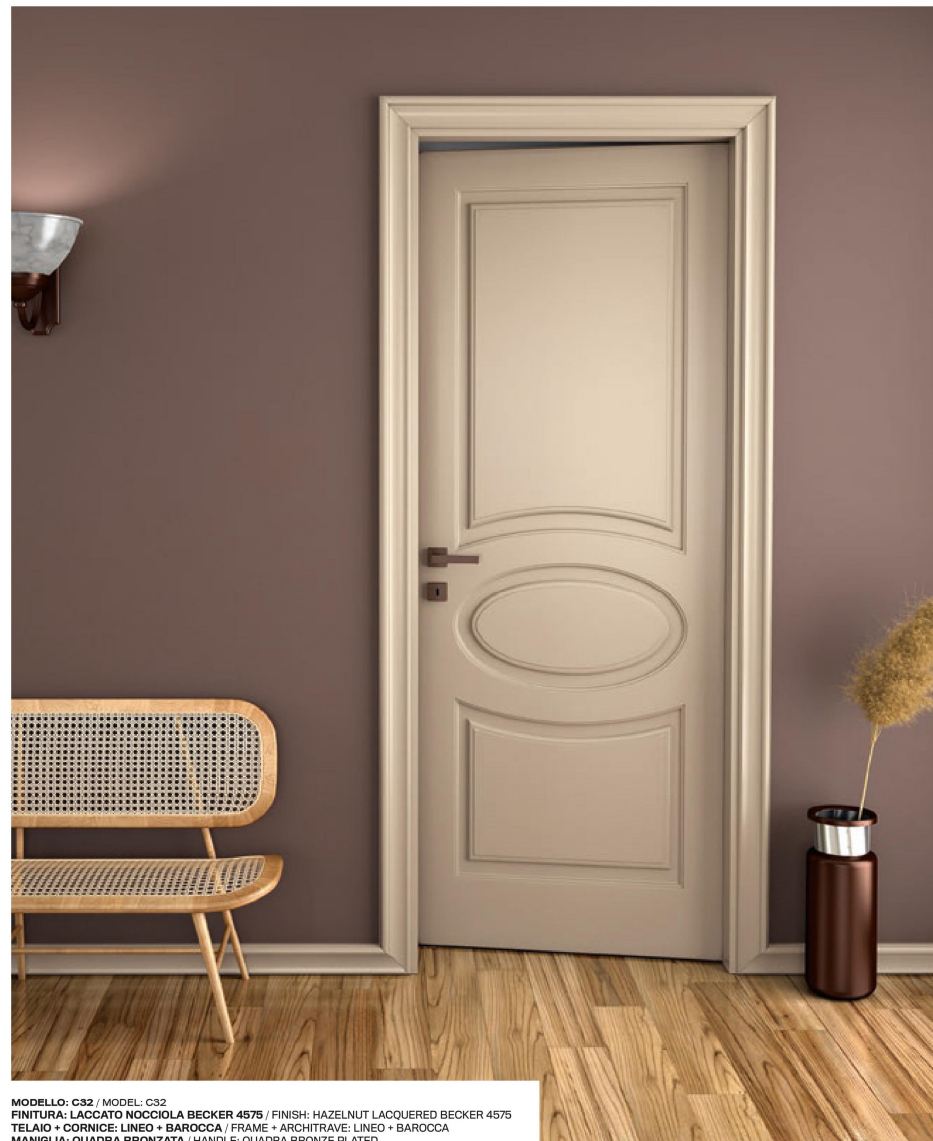
MODELLO: C32 / MODEL: C32 FINITURA: LACCATO NOCCIOLA BECKER 4575 / FINISH: HAZELNUT LACQUERED BECKER 4575 TELAIO + CORNICE: LINEO + BAROCCA / FRAME + ARCHITRAVE: LINEO + BAROCCA MANIGLIA: QUADRA BRONZATA / HANDLE: QUADRA BRONZE PLATED

The type of pantograph created for Classika stands out more than in the other lines. From an aesthetic point of view, the design is more intense, decisive, thus amplifying the stylistic presence of the door compared to the rest of the furniture.